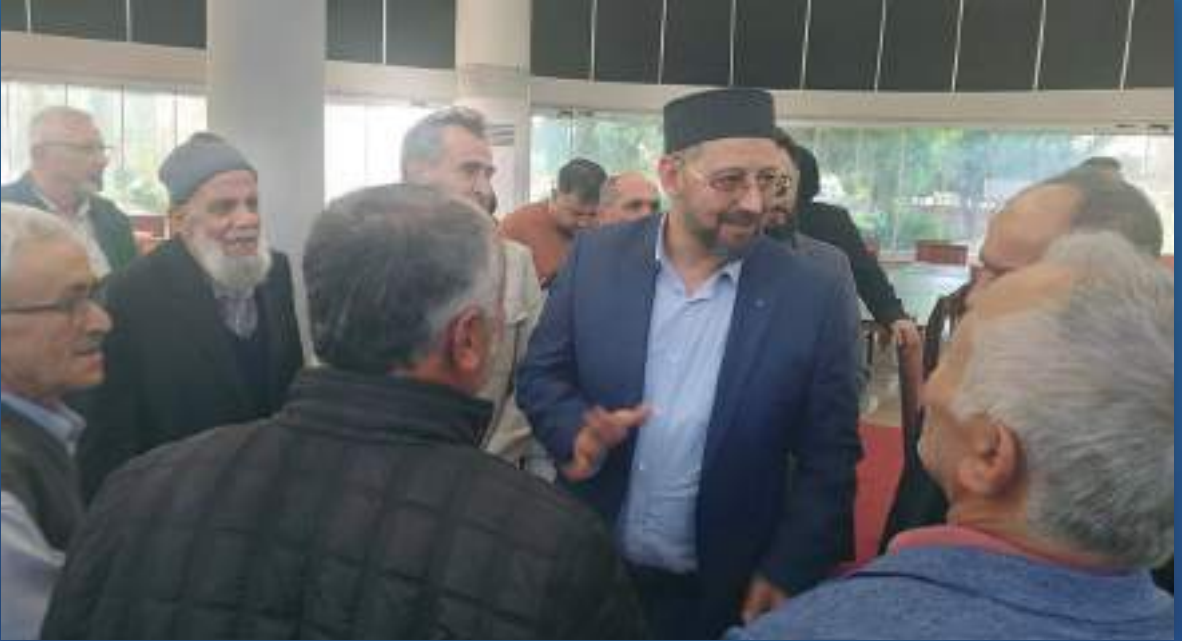
10.11.2024 İskenderun Ziyareti