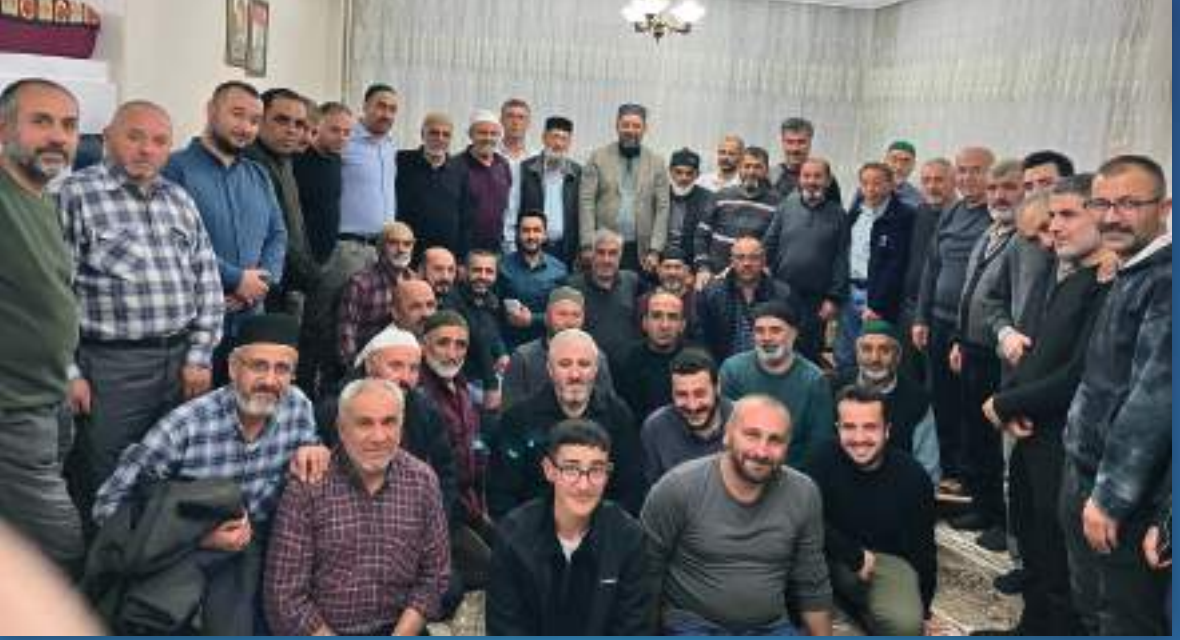
24.11.2024 Sohbet Kayseri