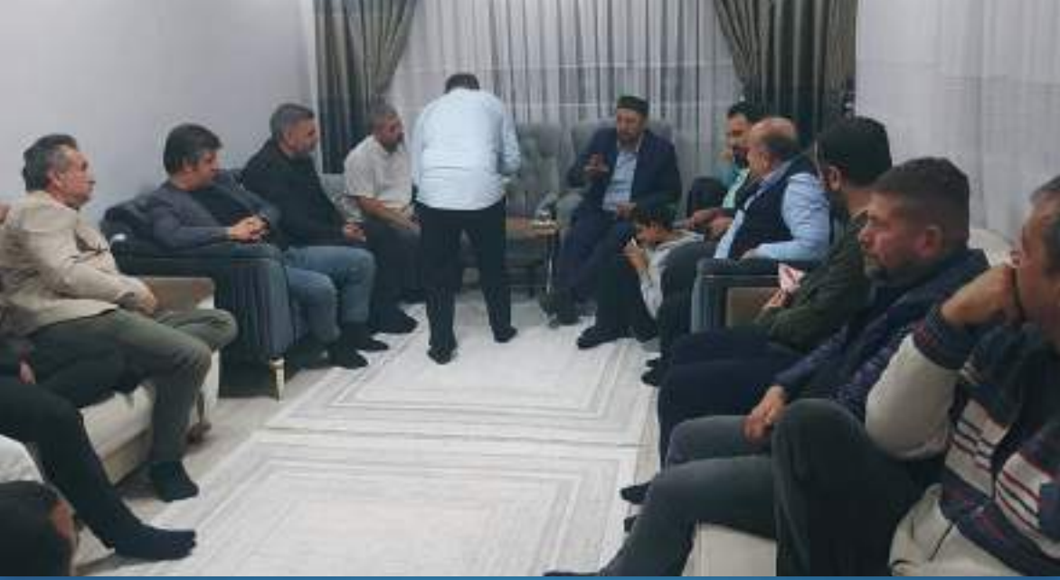
10.11.2024 Osmaniye Ziyareti