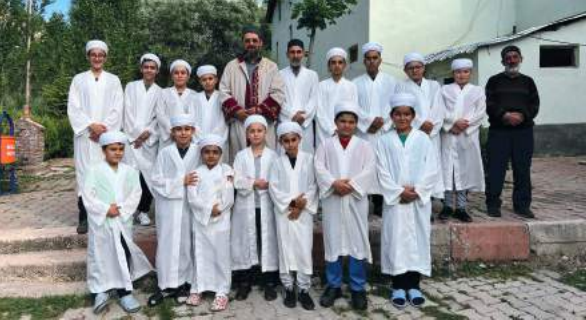
15.07.2024 Erkek Kuran Kursu