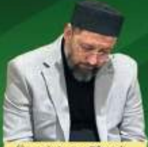
Üstad Arap Efendi