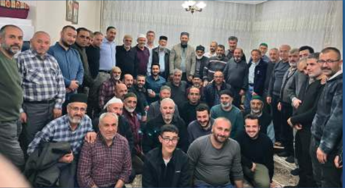
24.11.2024 Sohbet Kayseri