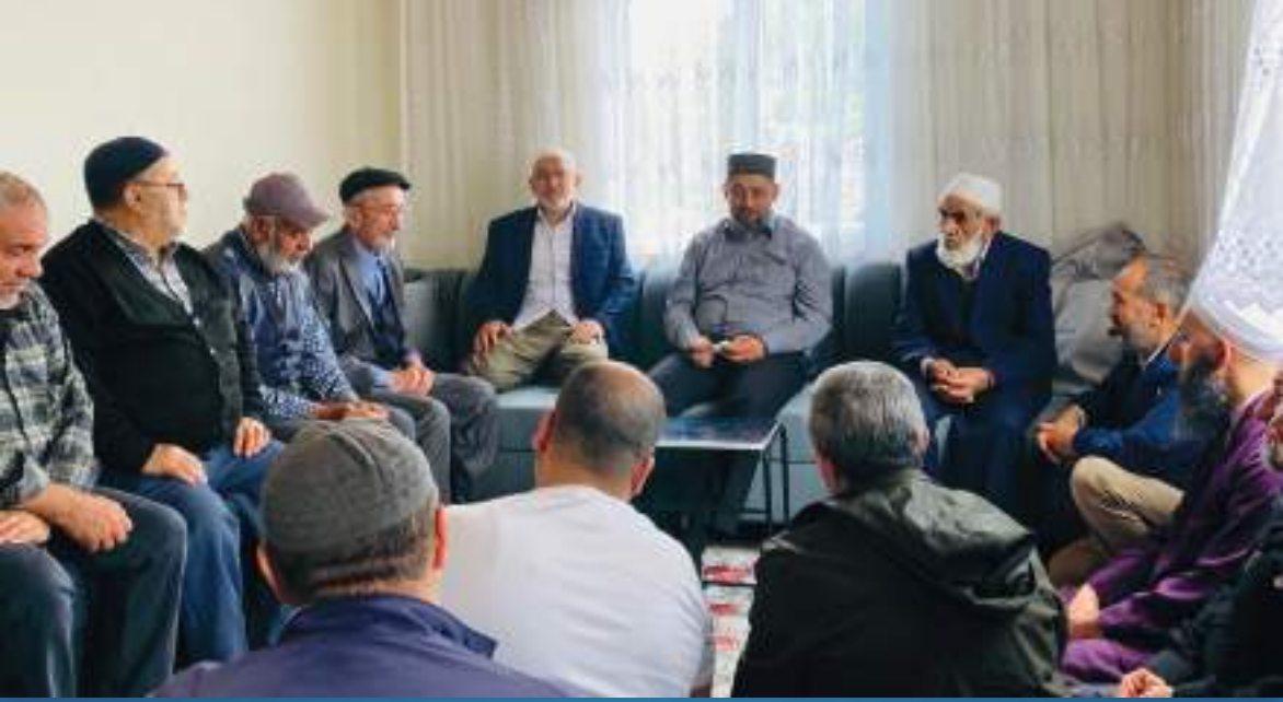
10.06.2024 Kayseri Tomarza Karapınar Şubesinin Açılışı