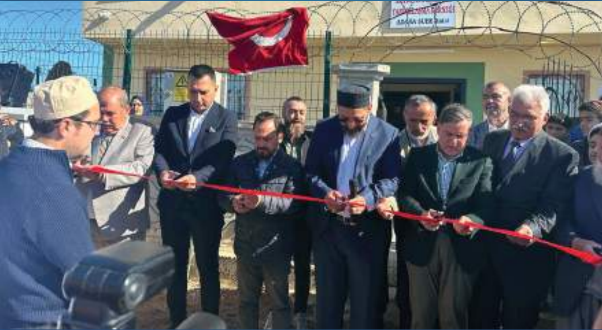
19.11.2023 Adana Kuran Kursu Açılışı