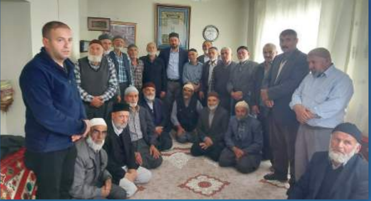
22 Mayıs 2022 Afşin Ziyareti