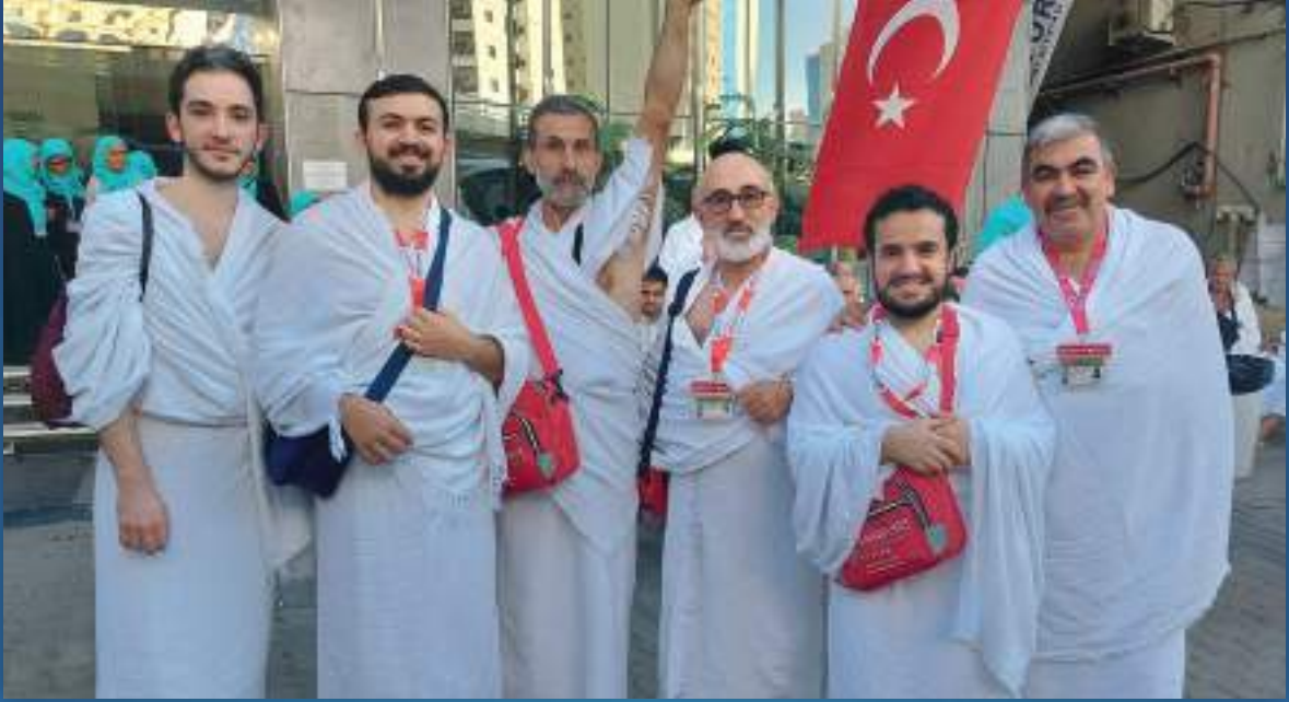
08 Ocak 2023 Umre Ziyareti