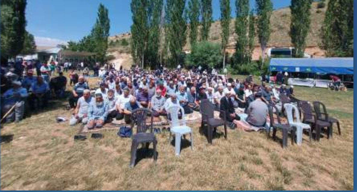
13 Ağustos 2023 Yıldönümü