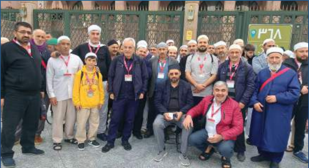
08 Ocak 2023 Umre Ziyareti