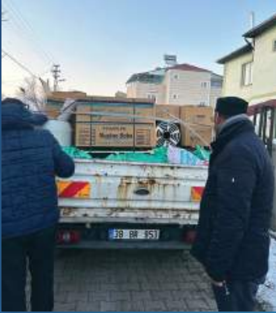
06 Şubat 2023 Derneğimizden Deprem Bölgesine Malzeme Yardımı