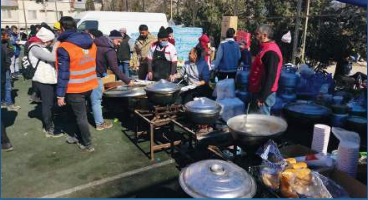
06 Şubat 2023 Derneğimizden Deprem Bölgesine Aşevi