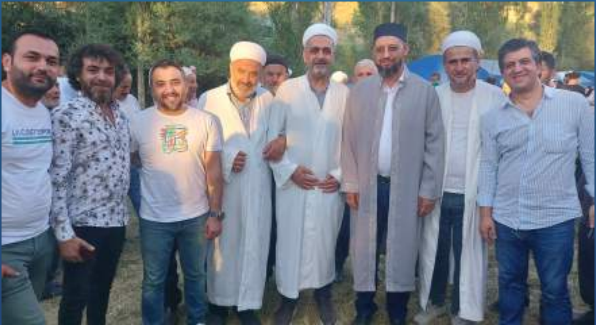
13 Ağustos 2023 Yıldönümü