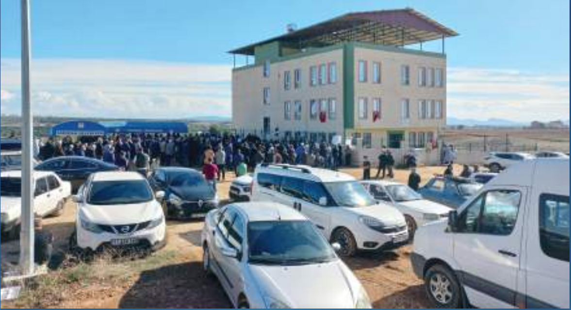
19 Kasım 2023 Adana Kuran Kursu Açılışı