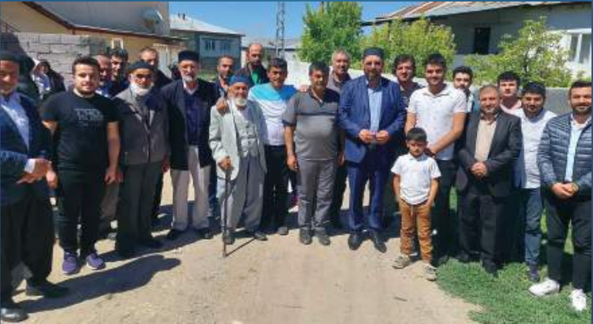
21 Mayıs 2022 Nadır Ziyareti