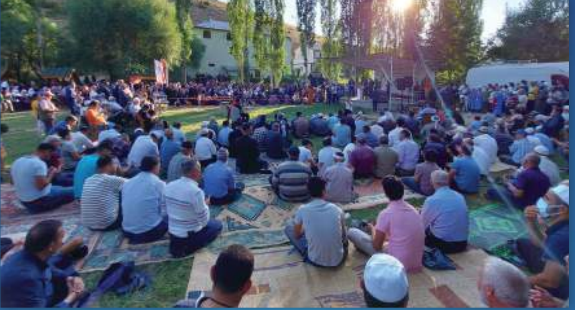
15 Ağustos 2022 Yıldönümü