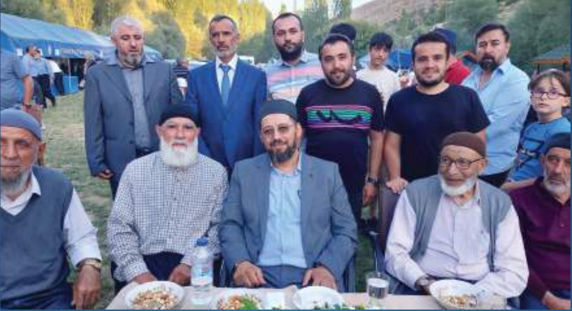
15 Ağustos 2022 Yıldönümü