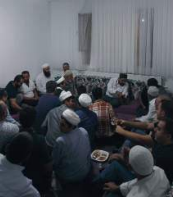
25 Eylül 2023 Ankara Ziyareti