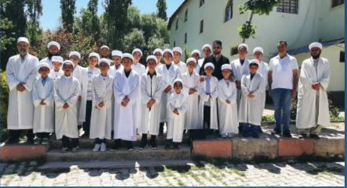
22 Temmuz 2023 Kırkgeçit Karahan Kuran Kursu