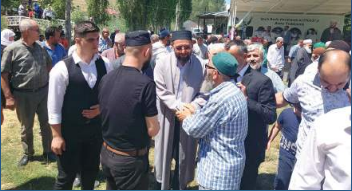
13 Ağustos 2023 Yıldönümü