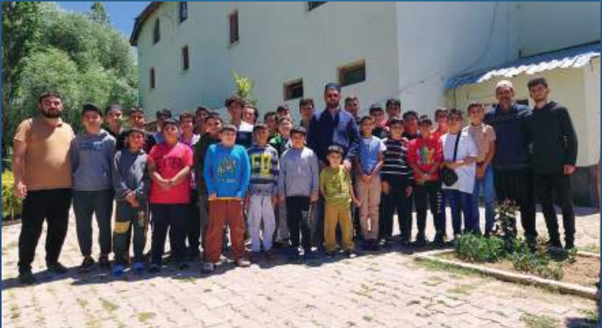
18 Temmuz 2022 Karahan Kuran Kursu