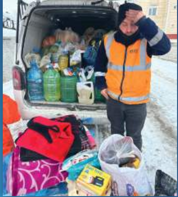
06 Şubat 2023 Derneğimizden Deprem Bölgesine Malzeme Yardımı