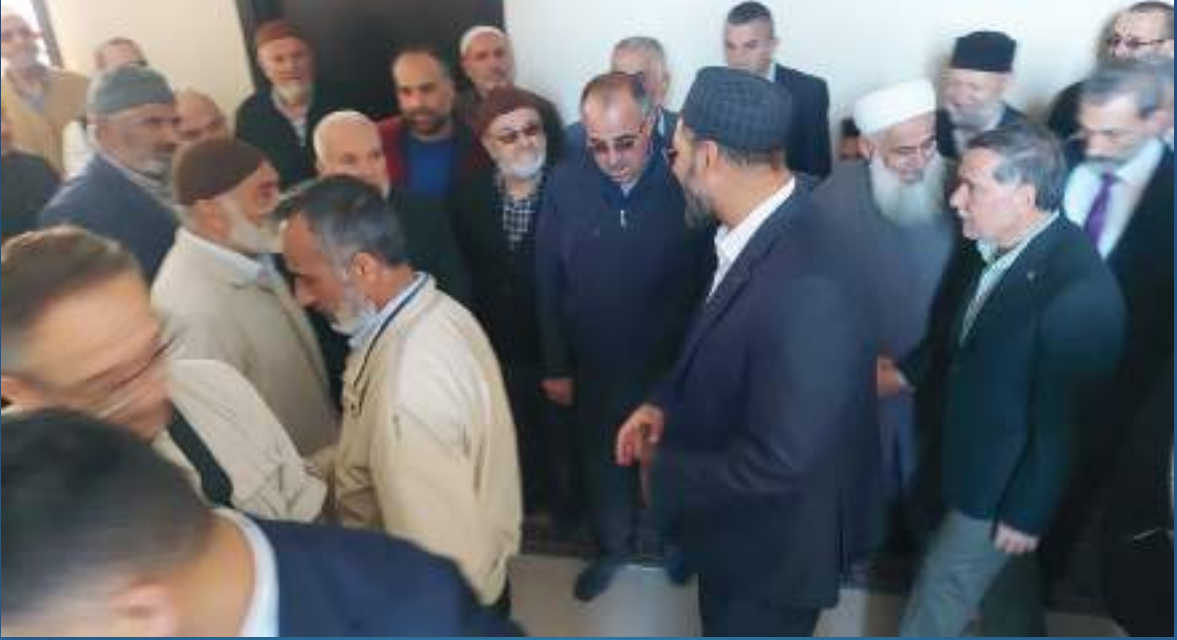
19 Kasım 2023 Adana Kuran Kursu Açılışı