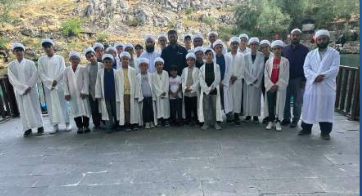
28 Temmuz 2023 Kuran Kursu Darende Gezisi