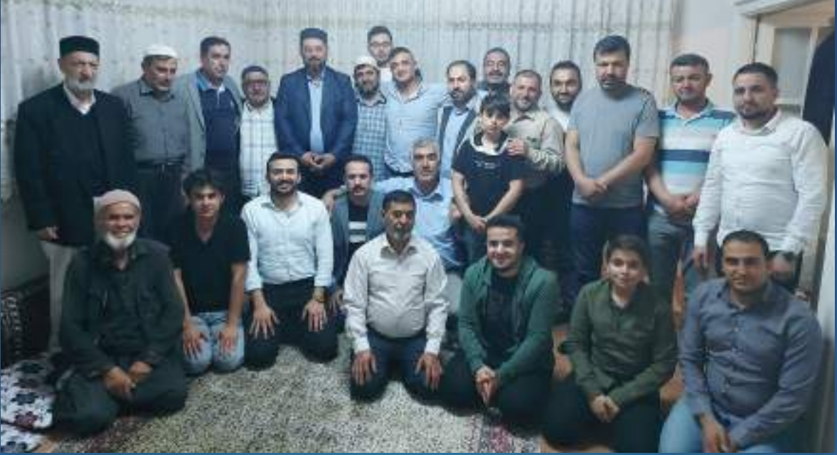
21 Mayıs 2022 Elbistan Ziyareti