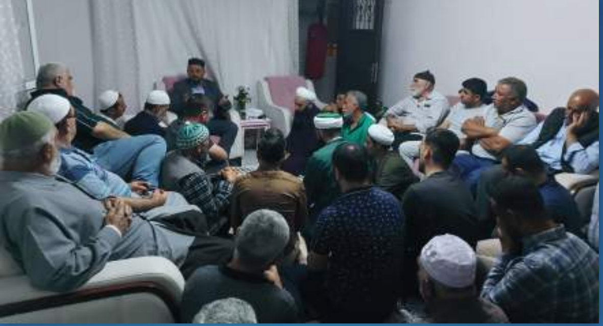
29 Ekim 2022 Adana Ziyareti