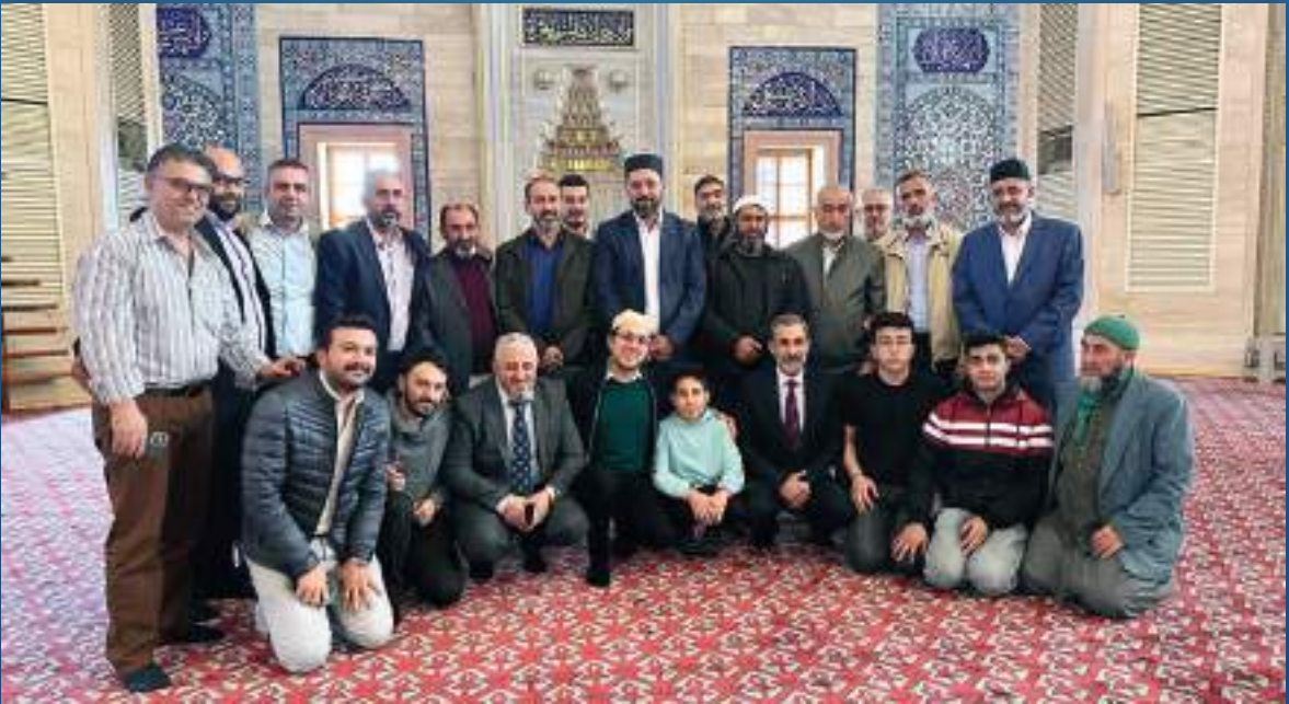
19 Kasım 2023 Adana Kuran Kursu Açılışı