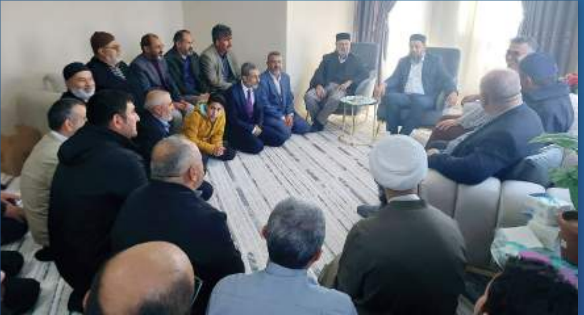
19 Kasım 2023 Adana Kuran Kursu Açılışı