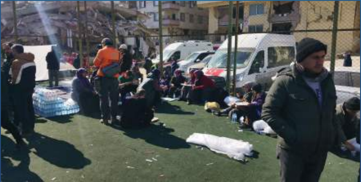
06 Şubat 2023 Derneğimizden Deprem Bölgesine Aşevi