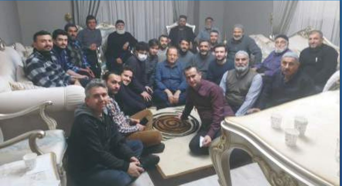
23 Aralık 2021 Kahramanmaraş Ziyareti