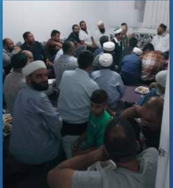
25 Eylül 2023 Ankara Ziyareti