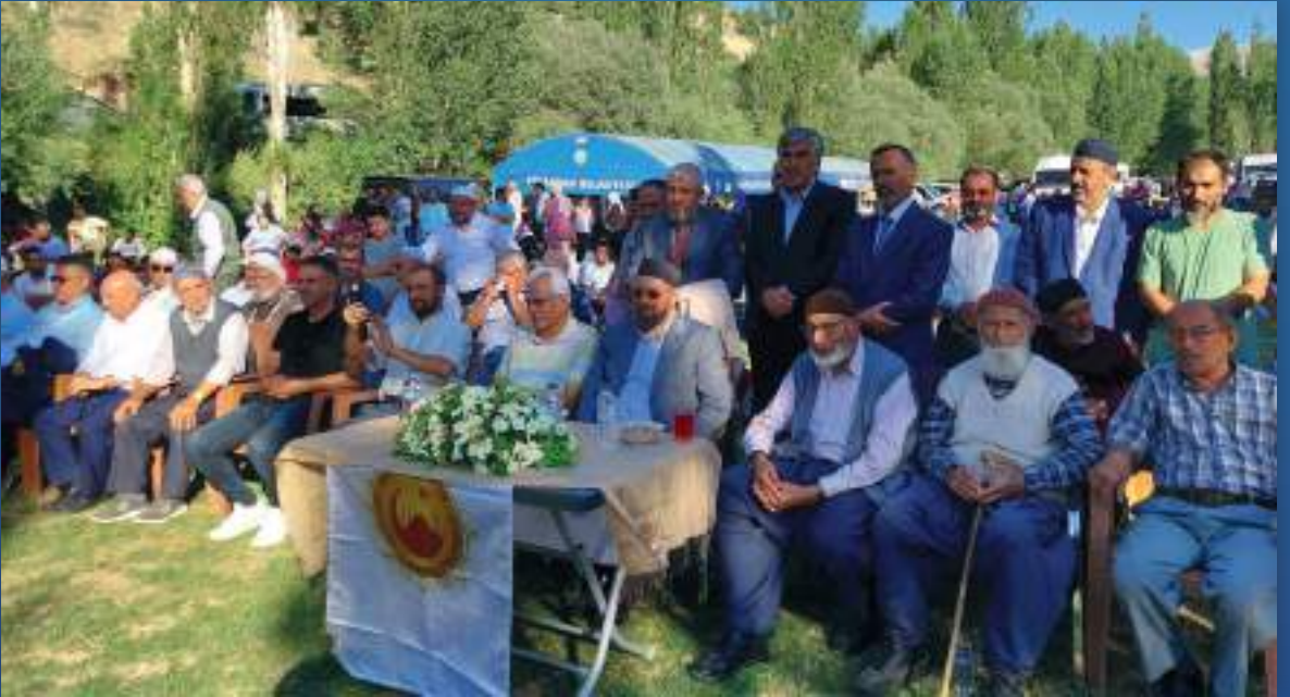
15 Ağustos 2022 Yıldönümü