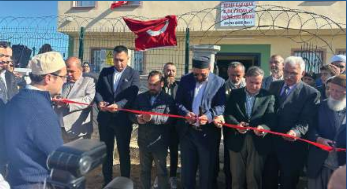
19 Kasım 2023 Adana Kuran Kursu Açılışı