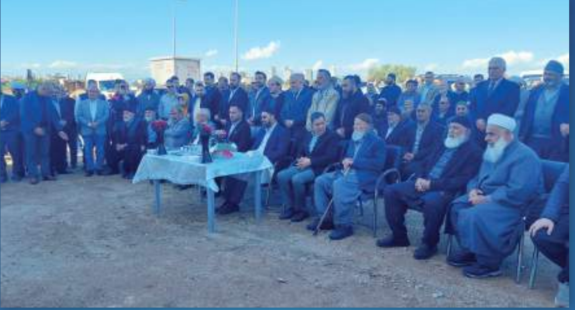
19 Kasım 2023 Adana Kuran Kursu Açılışı