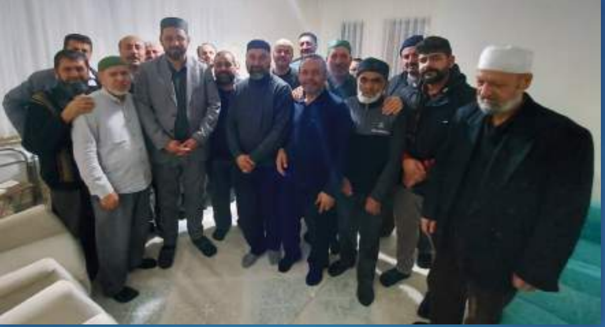
11 Aralık 2021 Nevşehir Ziyareti