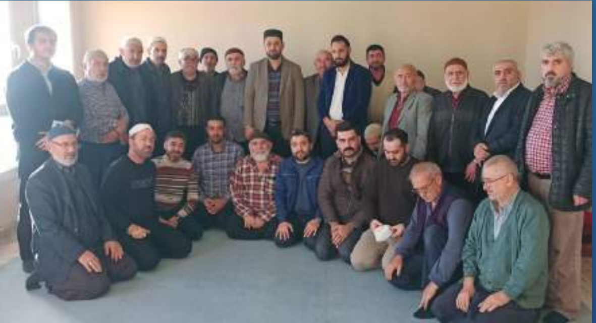
18 Aralık 2022 Adana Kuran Kursu Ziyareti