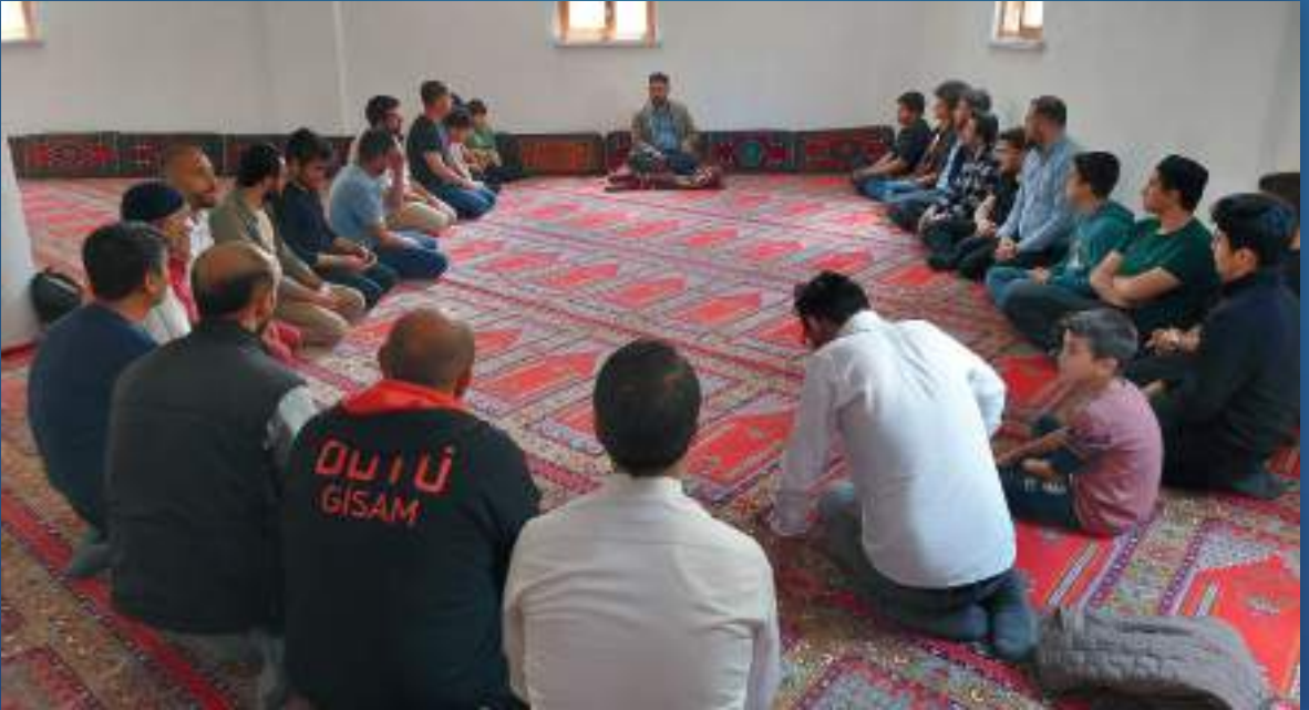
29 Mayıs 2022 Karahan Gençlik Buluşması