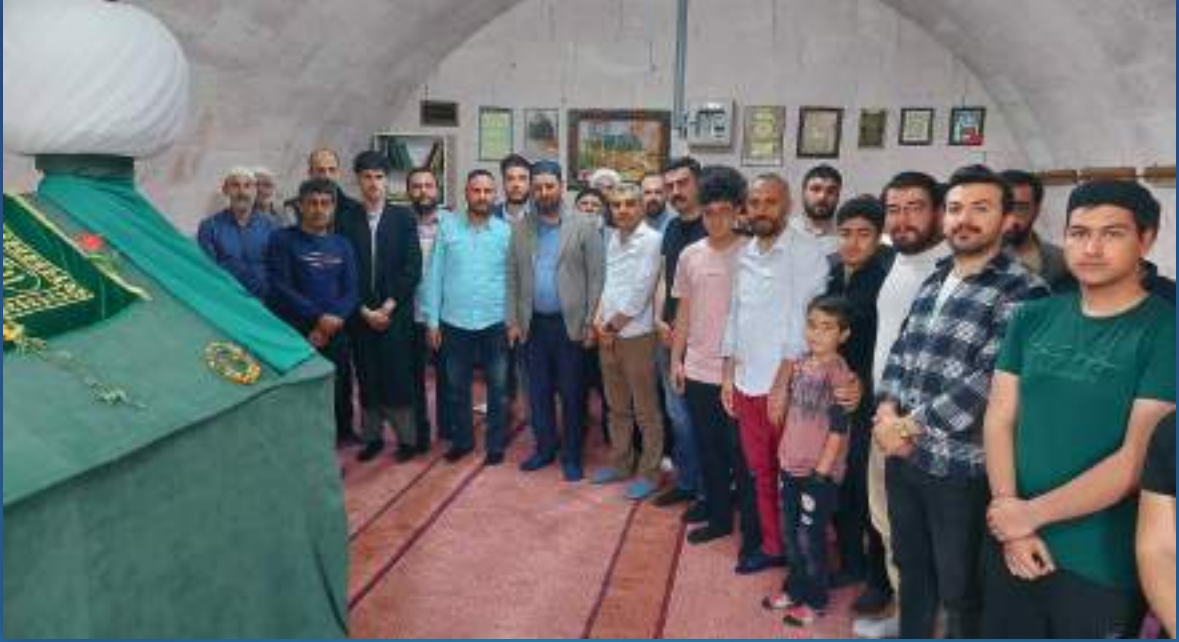
29 Mayıs 2022 Karahan Gençlik Buluşması