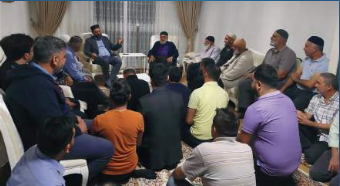
14 Ekim 2022 Kahramanmaraş Ziyareti