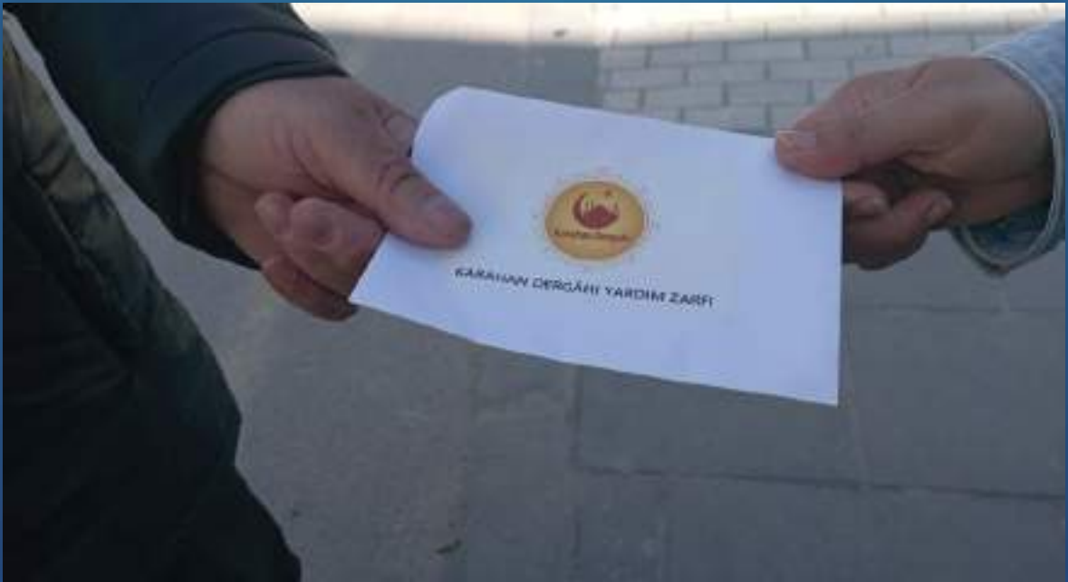
20 Nisan 2023 Ramazan Ayı Yardım Zarfı