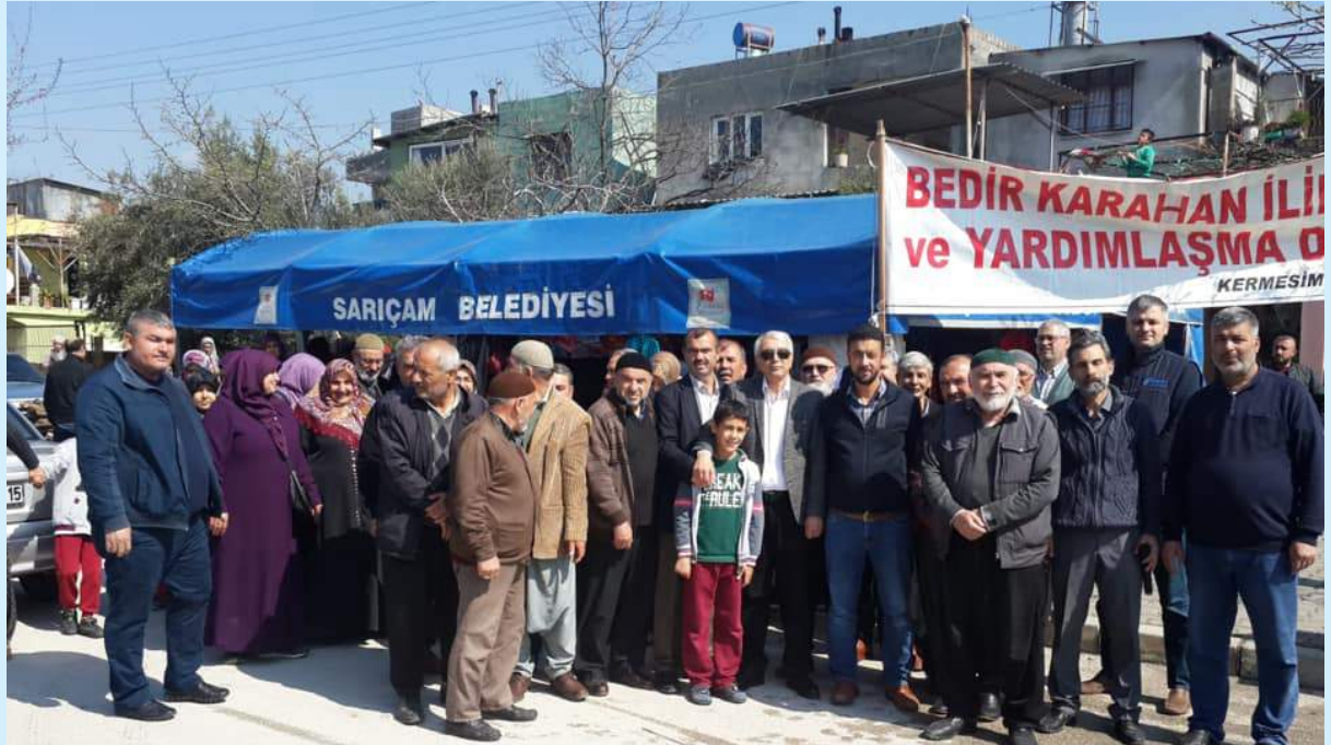
Adana 17-26 Mart 2019 Kermes