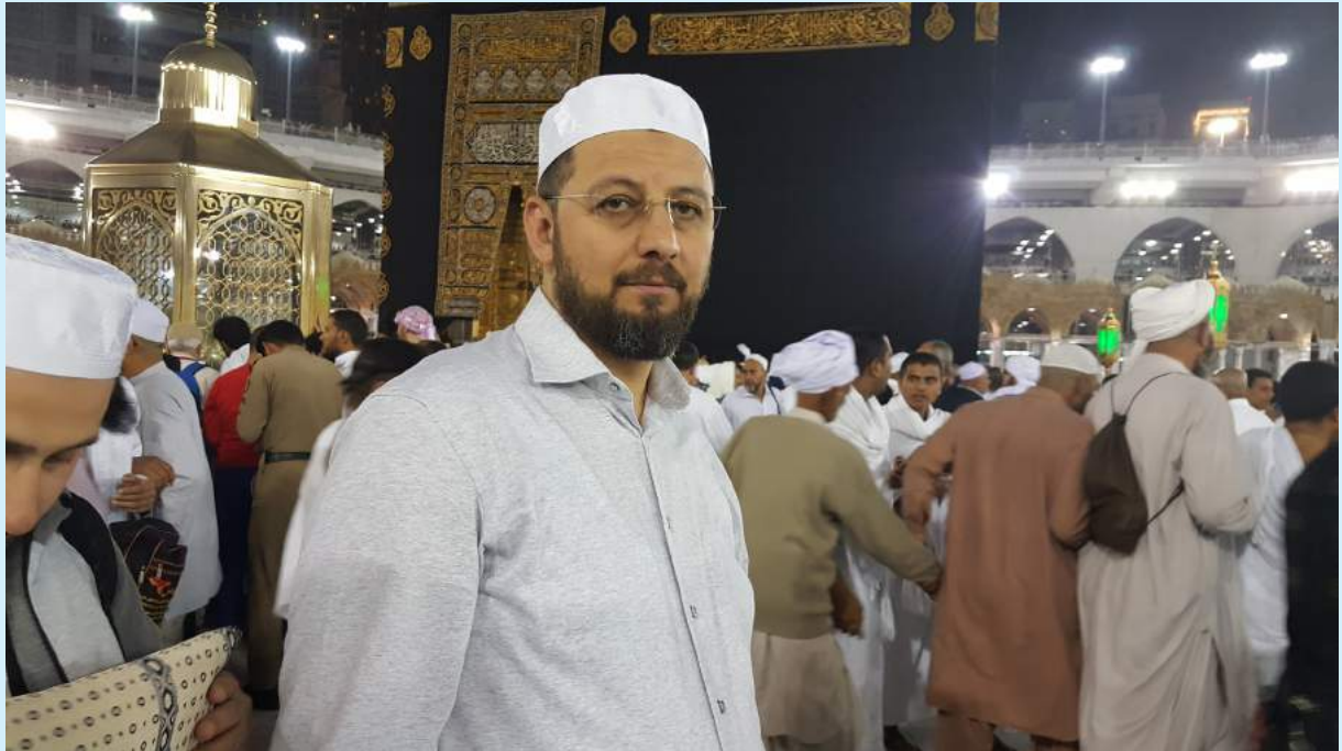
Umre 16 Şubat - 3 Mart 2019