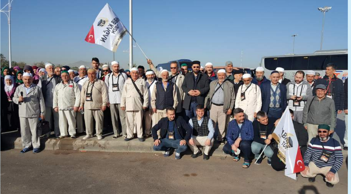
Umre 16 Şubat - 3 Mart 2019