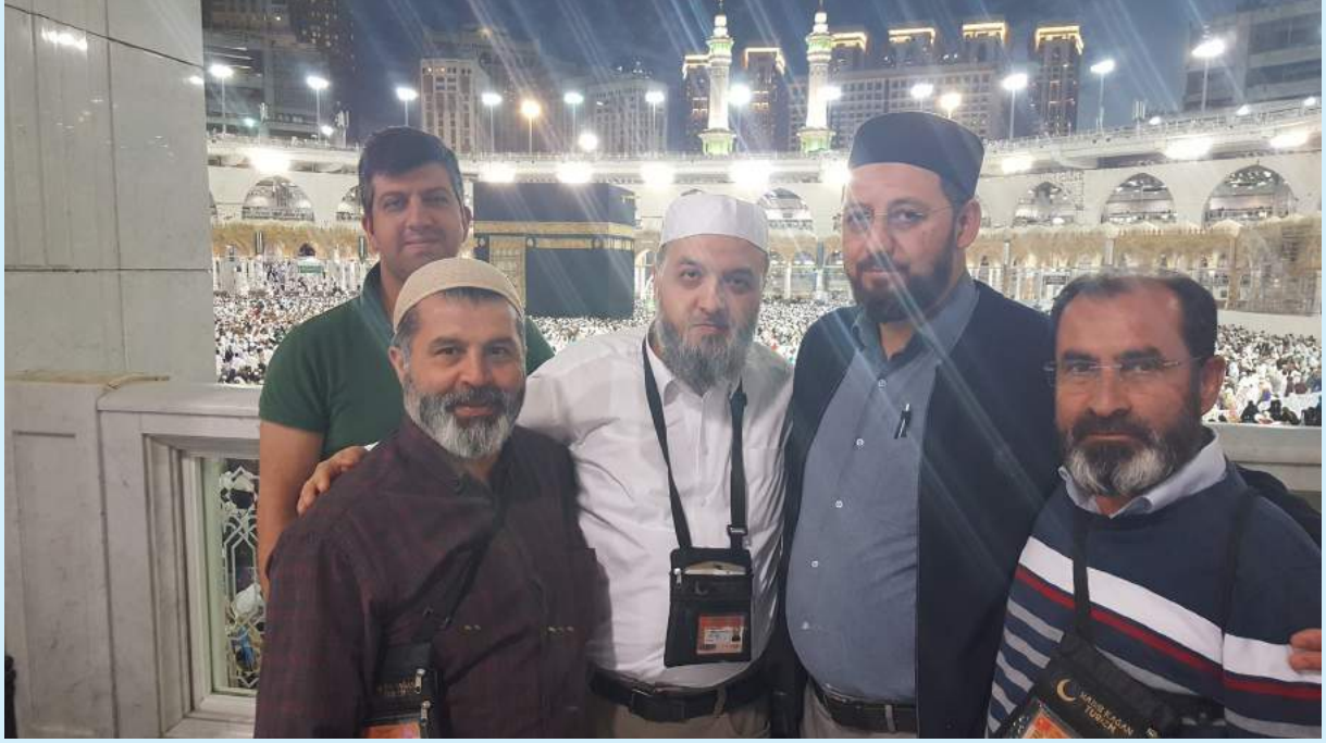
Umre 16 Şubat - 3 Mart 2019