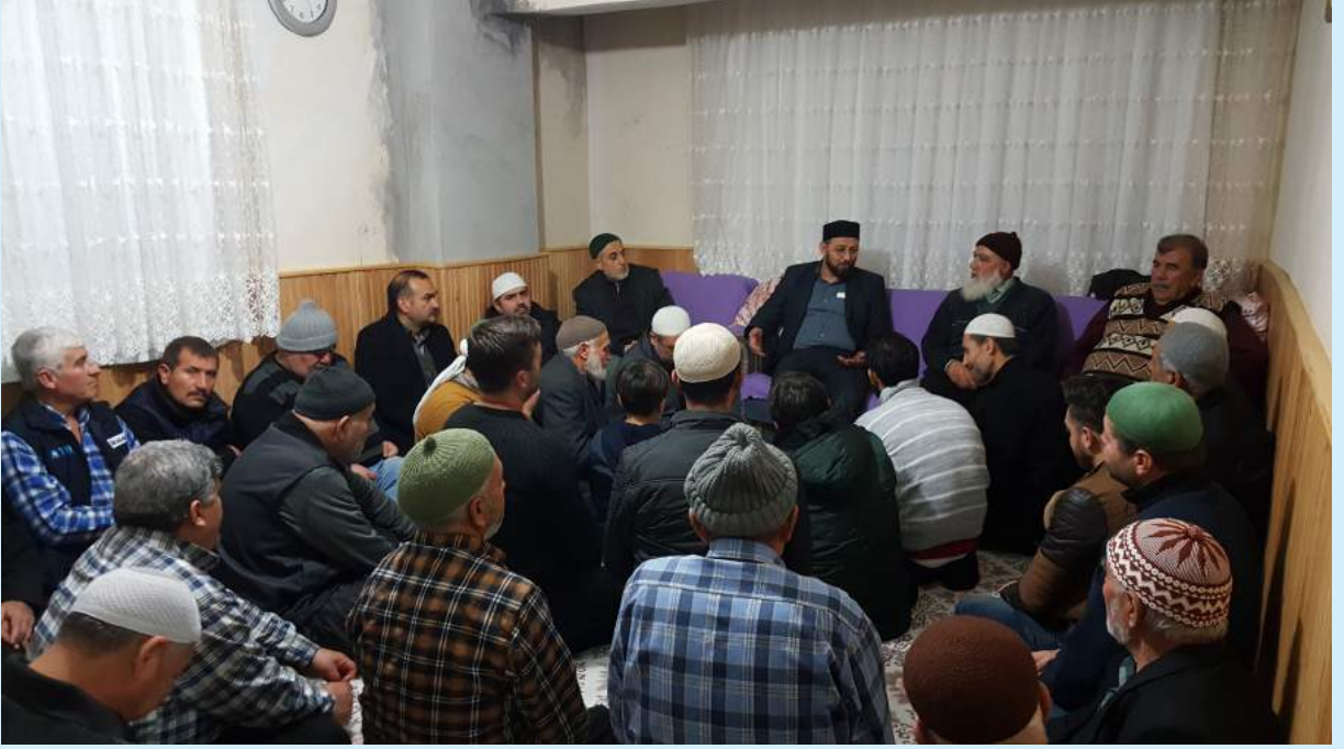
Adana Ziyareti 4 Ocak 2019