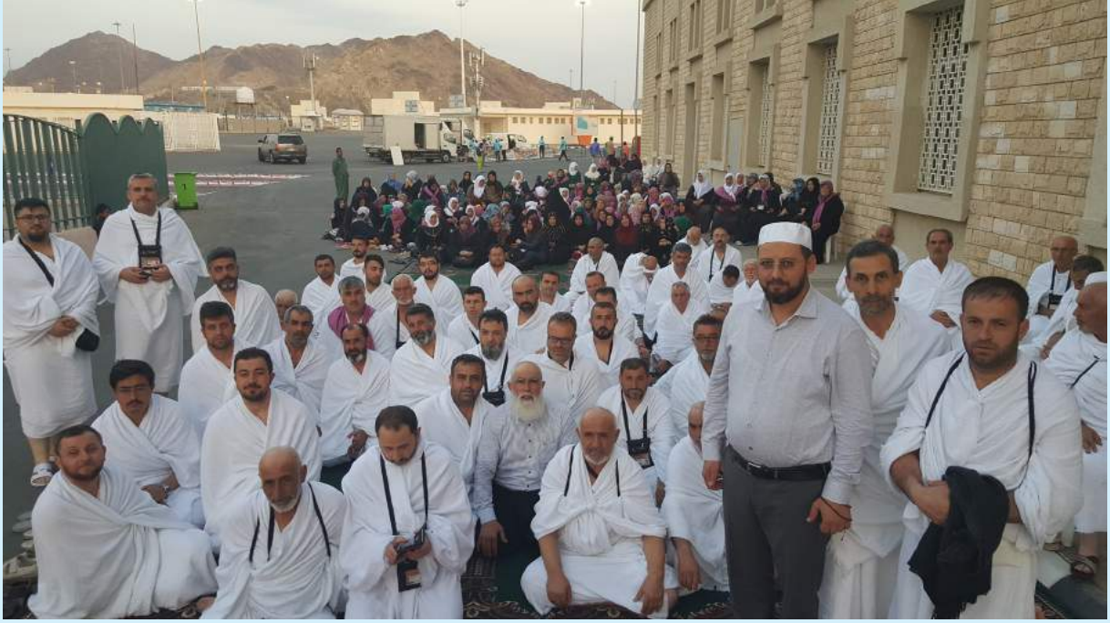
Umre 16 Şubat - 3 Mart 2019