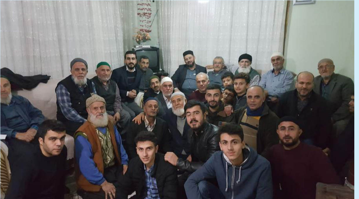
İskenderun Denizciler Ziyareti 5 Ocak 2019