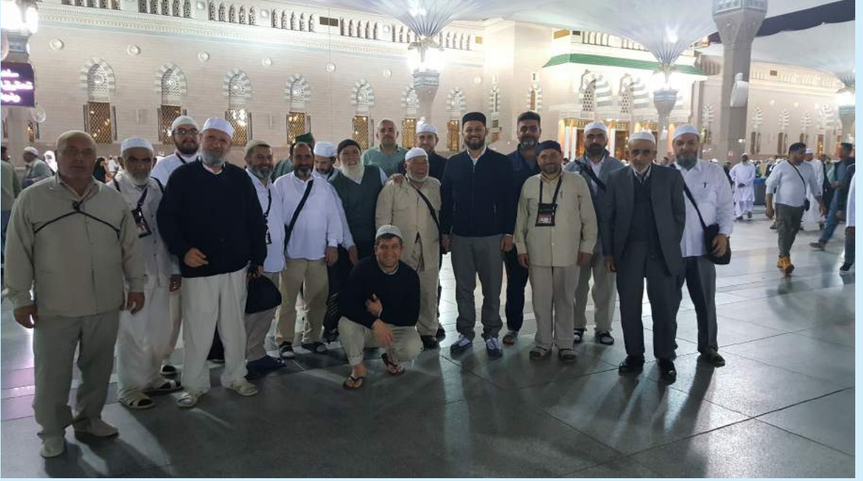
Umre 16 Şubat - 3 Mart 2019