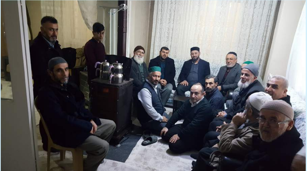
Hatay Ziyareti 6 Ocak 2019