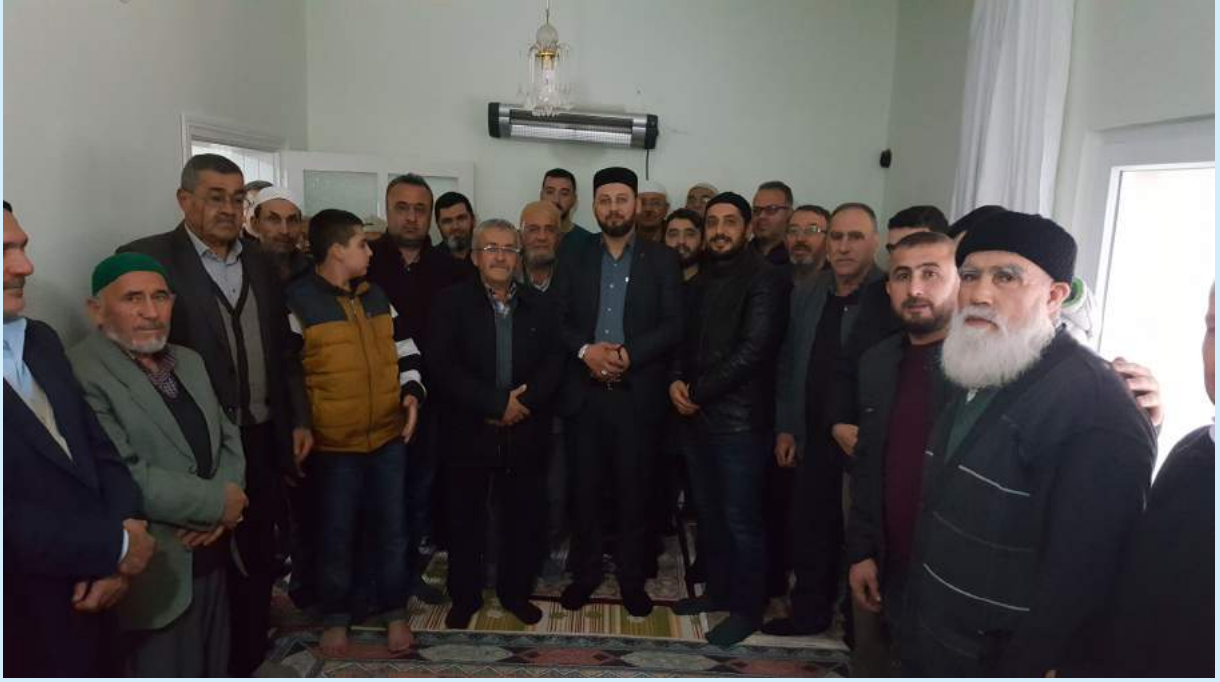
Dört Yol Ziyareti 5 Ocak 2019